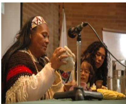
Blanca Nieves Abuela Muisca