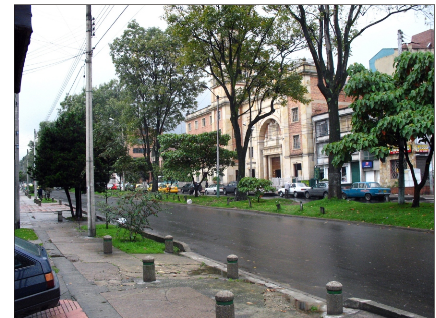
Avenida 28 calle 39A

La decisión fue adoptada con el fin de garantizar la seguridad del llamado "Nodo Institucional Concejo de Bogotá - Centro Administrativo Distrital (CAD)", donde además se encuentran otras entidades como el Instituto Nacional Penitenciario (INPEC), la Junta Administradora Local, la Contraloría Distrital, además de otros equipamientos de orden cultural, educativo, comercial y religioso.