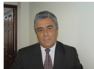
Dr. GERMÁN DARÍO RODRÍGUEZ Defensor del Espacio Público

Se tiene como propósito la seguridad, la protección, el señalamiento de unas restricciones especiales para el funcionamiento del sector y busca fundamentalmente mejorar el desarrollo urbanístico. Esta decisión se complementa con el decreto que expidió el alcalde mayor el año pasado de declarar este Nodo Institucional y busca fortalecer esta zona de la ciudad.